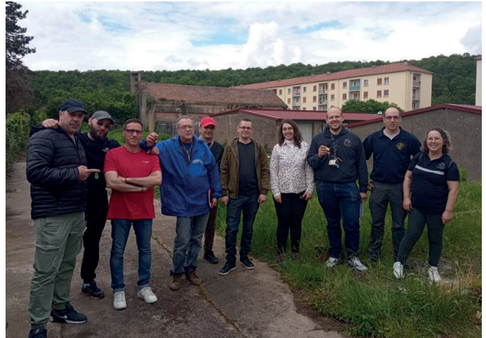
Les 4 associations travaillent ensemble sur le projet des jardins solidaires de l'Atelier de Transmission des Savoirs